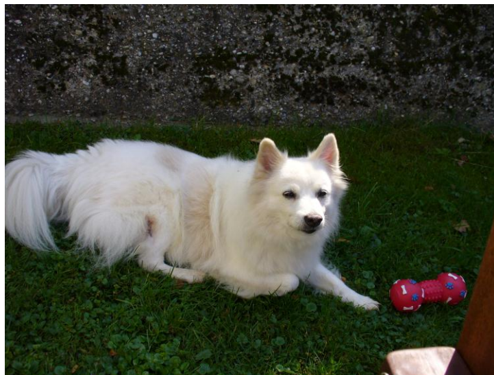
Justus, Spitz, 15 Jahre

Hunde brauchen – ähnlich dem Menschen – körperliche und geistige Beschäftigungen. Das erhöht nicht nur ihre Lebenserwartung, sondern auch ihre Lebensqualität.