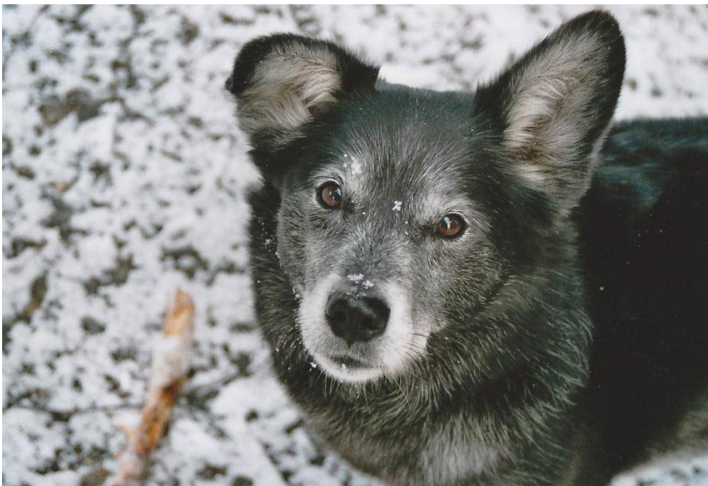
Sidney, Spitz-Mix, 12 Jahre

„Auf das Alter eingehen und die Liebe nicht versiegen lassen, jede Minute mit dem alten Hund genießen, er hat es sich verdient“ (B. Mensch von Jeany, Griffonmix, 13 ½ Jahre)