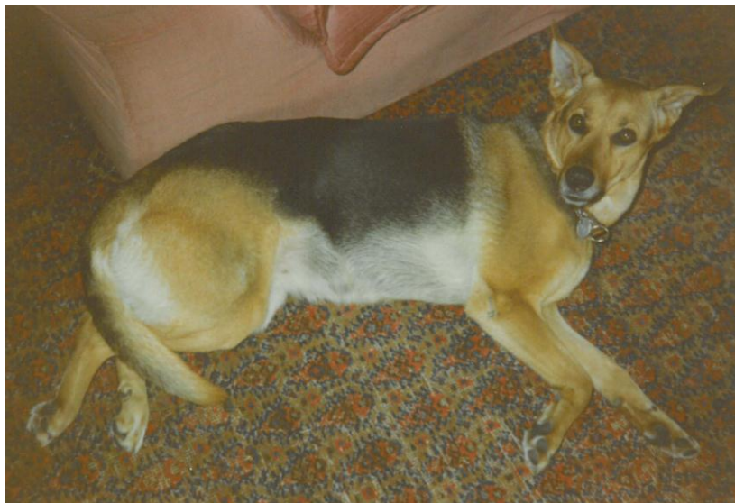
Daisy, Schäfer-Jagdhund-Mix, 8 Jahre

Das Ruhe- und Schlafbedürfnis steigt mit dem Alter. Ein erwachsener Hund braucht durchschnittlich sechs Stunden Ruhe und 12 Stunden Schlaf. Ein alter Hund kann wesentlich mehr benötigen. Machen Sie mal eine 24-Stunden-Aufzeichnung, diese gibt Ihnen Aufschluss über Aktivitätsniveau und damit auch das Ruhebedürfnis Ihres Hundes.