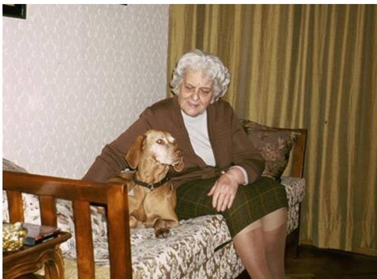
„Zusammen alt werden“

Das Altern des Hundes ist vergleichbar mit dem Altern des Menschen. Unser Körper will oft nicht mehr so wie früher und Erkrankungen können zunehmend auftreten.